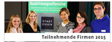
Teilnehmende Firmen 2015